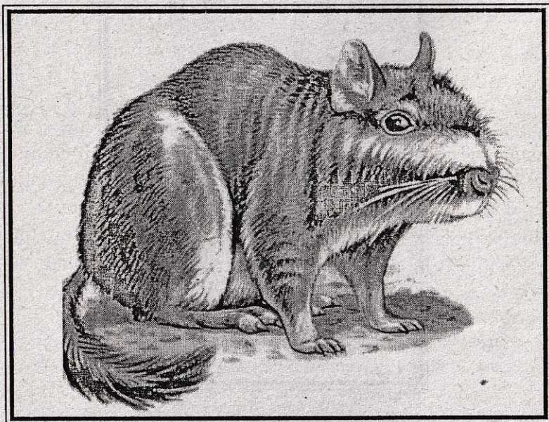
Chinchilla mare, America de Sud